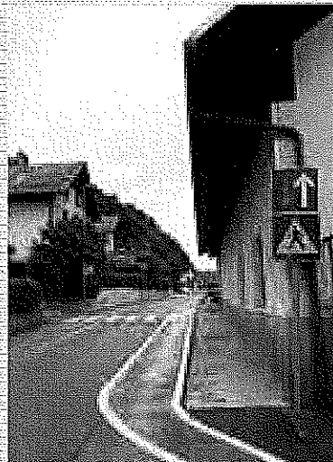
Pešpot ob Poljanski cesti

Boštjan Kočar, Občina Gorenja vas - Poljane